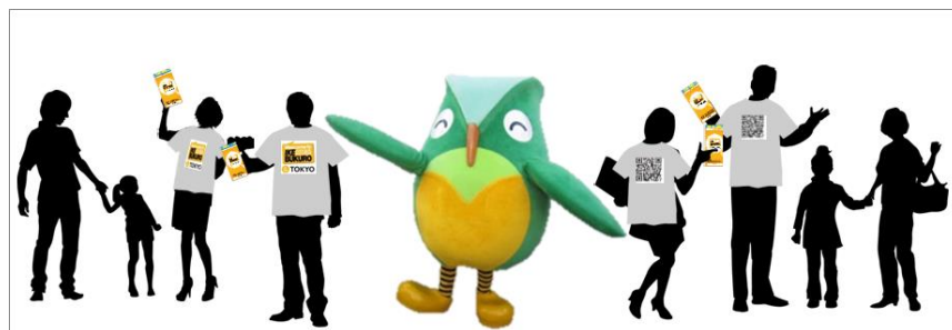
※クーポン配布イメージ

この報道資料は、ときわクラブ、丸の内記者クラブ、JR記者クラブ、レジャー記者クラブ にご案内しています